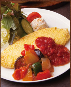
国産野菜の ラタトゥーユ・オムレツ