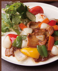
いわて純情豚の 生姜焼き