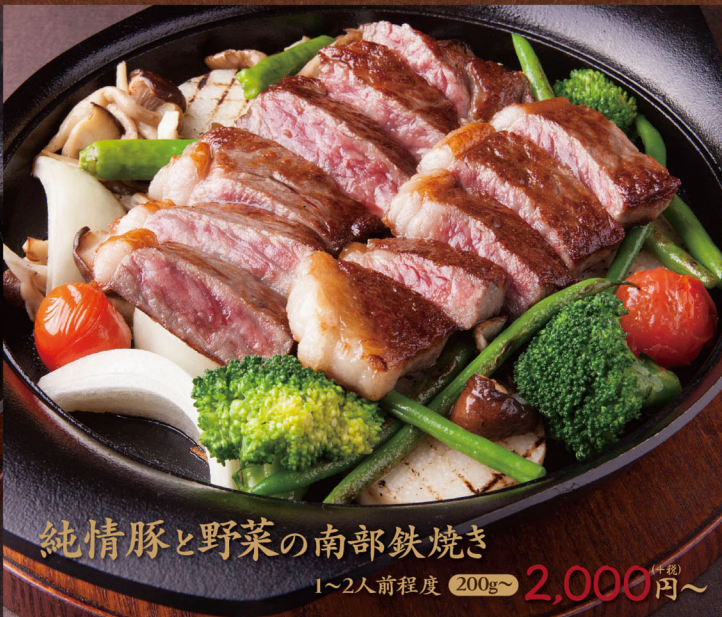
純情豚と野菜の南部鉄焼き