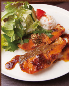
三陸サーモンの 粒マスタード焼き