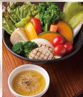
三陸産 サバーニヤ カウダー