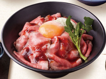
純情牛の ローストビーフ丼