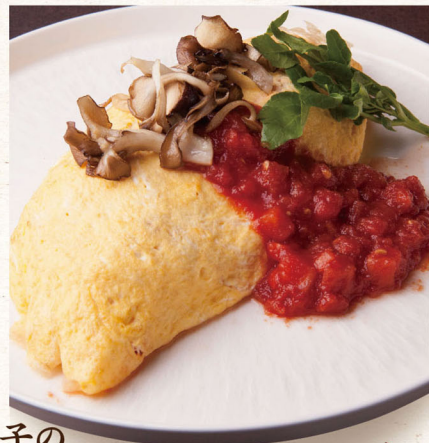
いわて玉子の オムライス