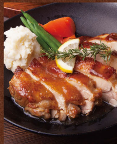
菜彩鶏の レモンステーキ