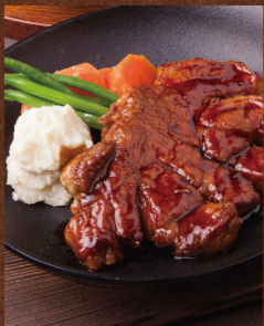
名物いわて純情豚の 蜂蜜ロースト