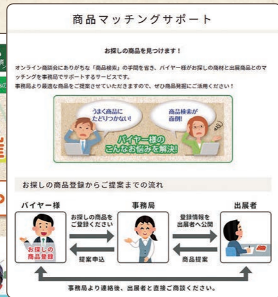
特別企画で好評だった「商品マッチングサポート」