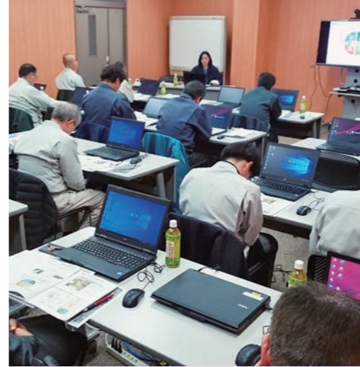
令和2年2月開催のアグリビジネススクールの様子