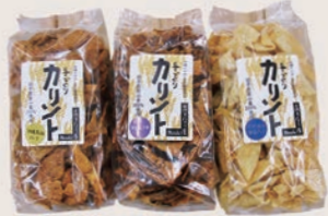
手づくりカリント3種類 (黒糖・塩・甘醤油) (各180g)