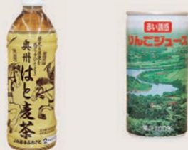
はと麦茶 (500ml) 赤い誘惑 りんごジュース (195ml)