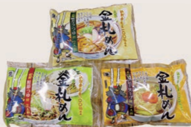
えさし金札めん2食入り 3種(鴨ガラ・鮭節・カレー)