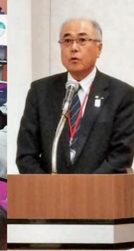
苅谷常務(現専務)人材育成講演