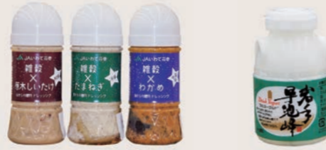
ドレッシング3種 (原木しいたけ・玉ねぎ・わかめ) 岩手早池峰 飲むヨーグルト (150ml)