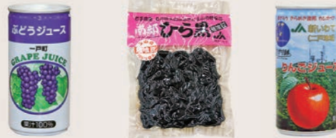
小鳥谷 ぶどうジュース (195ml) 玉山南部ひら黒 りんごジュース (130g) カシオペア りんごジュース (195ml)