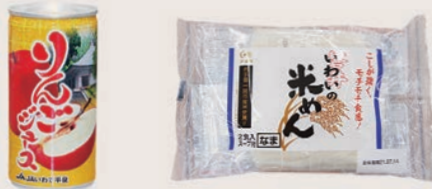
りんごジュース (195ml) いわいの米めん (スープ付)