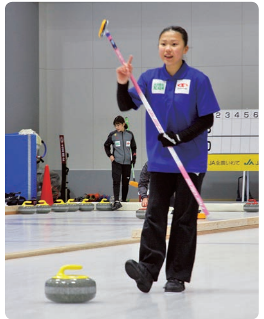
昨年の大会の様子

JA全農は、2010年からカーリング女子日本代表オフィシャルスポンサー契約を締結し、各主要大会に特別協賛を行ってきました。今年度もJA全農いわてが特別協賛する「ミックスダブルスカーリング選手権大会」の岩手県大会が開催されます。上位入賞チームや参加者へは「純情産地いわて」の商品を提供します。「2021いわて純情むすめ」は大会ナビゲータを務める予定です。お楽しみに!!