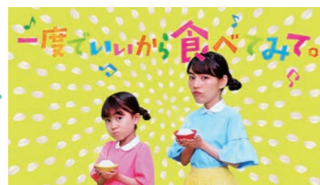
♪～ 「一度でいいから食べてみて。」