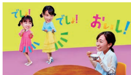
主婦「おいし！」 おコメディアンズ「でしょ！」