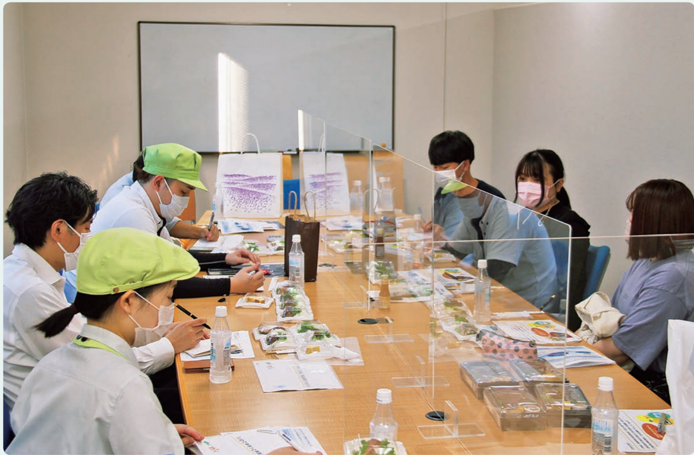
(株)いわちくと学生による話し合い