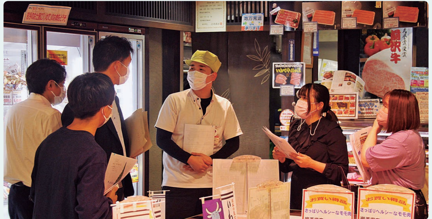
(株)いわちくによる「いわちくキッチン」の店舗紹介の様子

た。この企画のテーマである『いわて牛と県産食材を使用し、若者でも手軽に購入しやすく、自宅での再現性が高いこと』を実現するため、学生たちは4つの試作品を試食し①肉質②味③見た目④価格⑤パッケージの5つの項目について、様々な視点から意見を出し合いました。その結果、県産りんごのたれといわて牛の切り落としを使用した焼き肉弁当を商品化することに決定しました。 学生達は、「弁当を食べて頂くことで同世代の方々にもいわて牛のおいしさを知ってもらい、店頭でいわて牛を買うきっかけになってくれたら嬉しい。」と想いを語りました。 今回商品化した「いわて牛牛っと弁当」は、10月22日(金)〜24日(日)に盛岡駅ビルフェザン本館B1F「いわちくキッチンフェザン店」にて開催される予定の「いわちくキッチン周年祭」にて数量限定で販売されます。