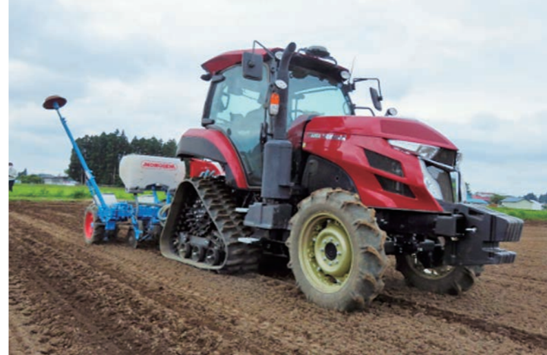
自動操舵トラクター