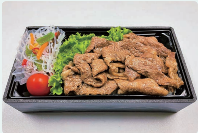
決定した「いわて牛牛っと弁当」のイメージ