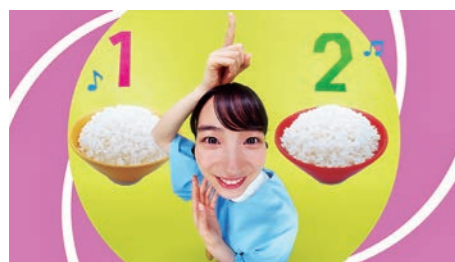
のんさん 「一度でいいから食べてみて。」