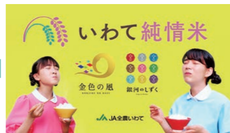
♪～ 「いわてのいわての純情米」