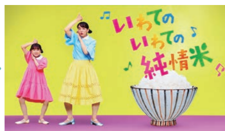
♪～ 「いわてのいわての純情米」