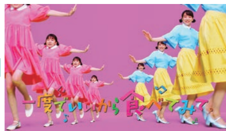
♪～ 「一度でいいから食べてみて。」