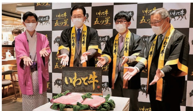
チャンピオン牛お披露目会の様子