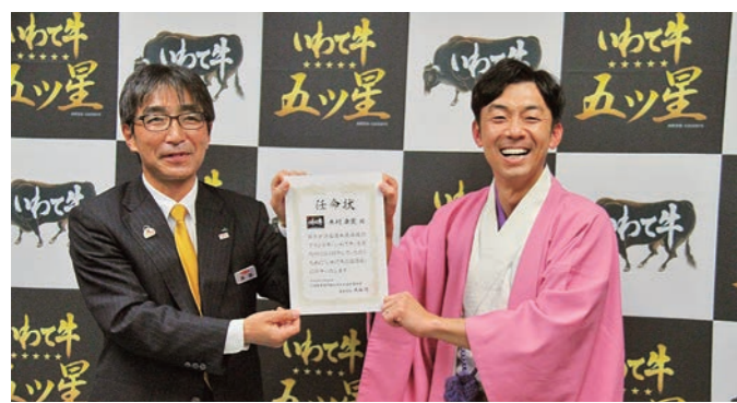
いわて牛応援団長任命式