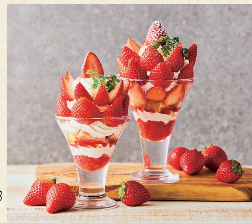
左ミニサイズ、右レギュラーサイズ