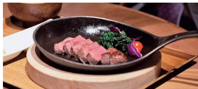
みのるダイニングでのチャンピオン牛フェア