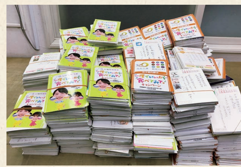
たくさんのご応募ありがとうございます

このキャンペーンでは、応募者の中から抽選で、A賞「いわて牛サーロインステーキ(200g×3)」が200名、B賞「中村家三陸海宝漬」が100名、Wチャンス賞「JA全農いわてオリジナルクオカード」が710名、合計1,010(いわてん)名に豪華景品がプレゼントされます。景品は順次発送される予定で、景品受け取りをもって当選となります。