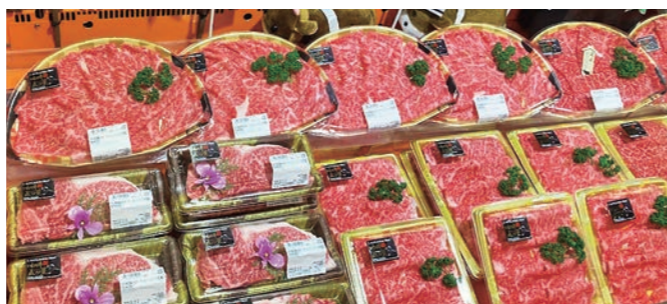
いわて生協でのチャンピオン牛フェア