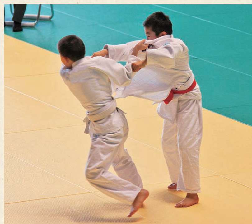
白熱した試合が繰り広げられます