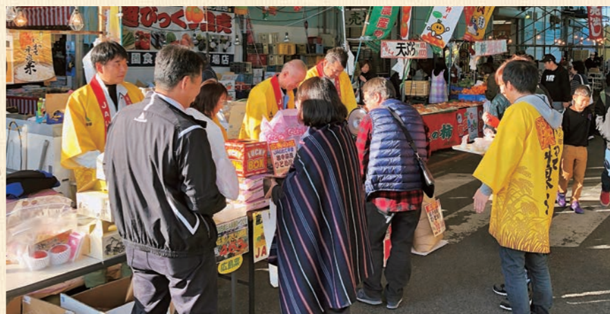
コロナ禍以前に実施した販促応援の様子

令和3年12月8日に農林水産省より公表された岩手県の作況指数は「103」の「やや良」となりました。米の主要産地においても豊作基調となっています。