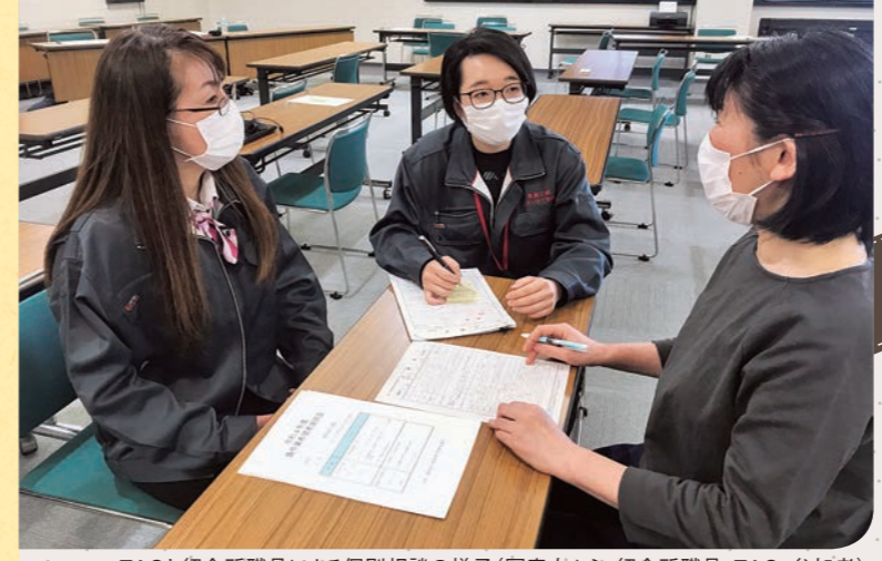
TACと紹介所職員による個別相談の様子(写真左から、紹介所職員、TAC、参加者)