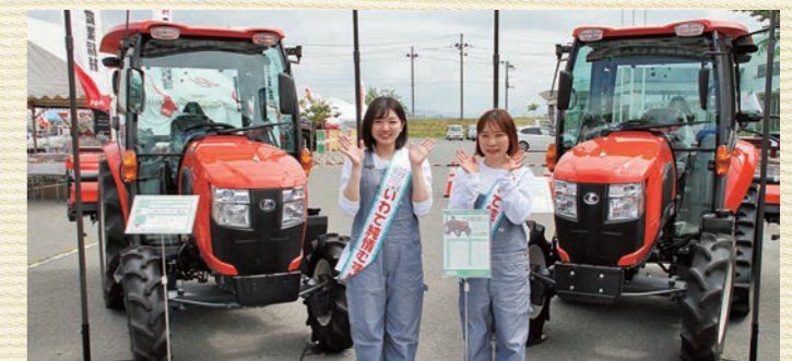
JAグループ共同購入トラクター