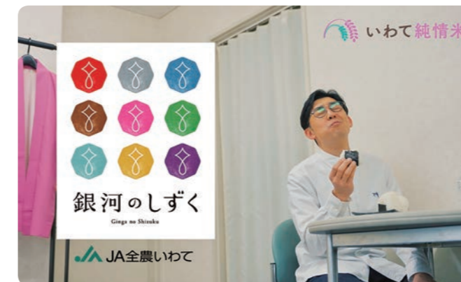
●銀河のしずく 日常のひとこま篇(15秒)