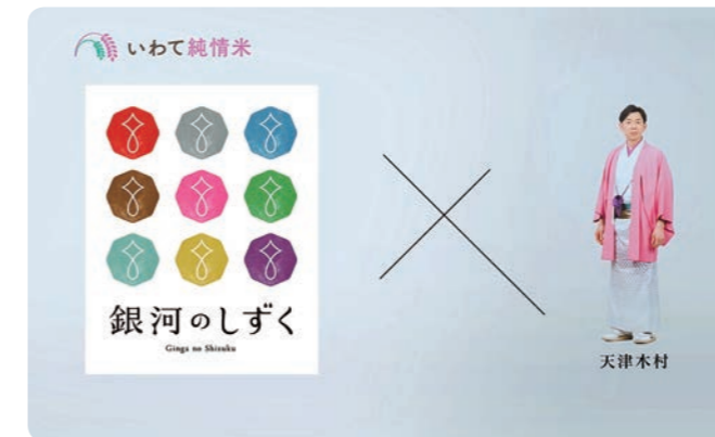
●銀河のしずく 吟じます篇(30秒)