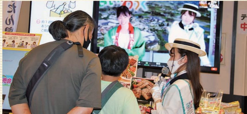
いわて銀座プラザでのオンラインイベントの様子

6月11日(土)～12日(日)の2日間では、東京都銀座5丁目にある岩手県のアンテナショップ「いわて銀座プラザ」内にある「いわてまるごとオンラインコーナー」に特設ブースを設置し、東京と岩手をオンラインでつないで来店者に商品のご紹介をしながら“畜産県岩手”の食材の魅力と岩手の雄大な自然を発信しました。