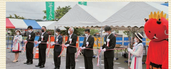
開会式セレモニーの様子

JAグループの取り扱い農業機械メーカー(肥料・農薬メーカー含む)「43社」が一同に出展し、農業機械だけでなく、肥料・農薬等農業生産資材の展示や補助事業相談や経営相談、農業機械のセルフメンテナンスコーナーなども設置され、生産者のトータルコスト低減に向けた支援の場となりました。