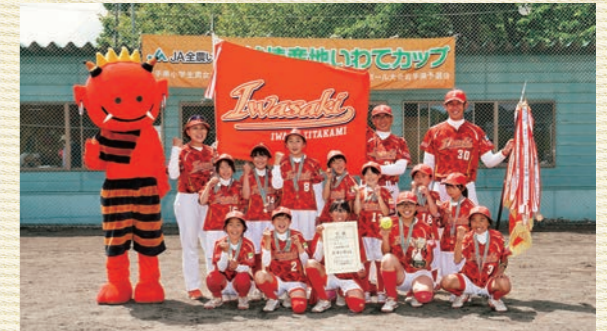
優勝 いわさきレッズ(北上市)

純情産地いわてで育まれた農畜産物をたくさん食べて、全国大会でもはつらつとグラウンドを駆け回ってください。ガンバレ!!