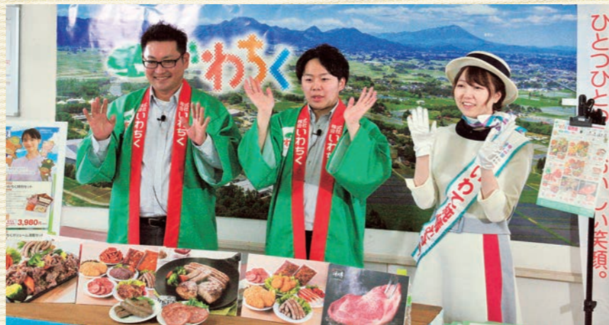
紫波町「ジョバンニ」と東京をオンラインでつなぎました