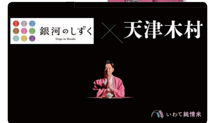
●銀河のしずく 食卓の新しい主役篇(15秒)