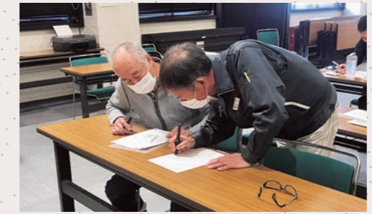
JAが制作した農作業マニュアル動画 (JAいわて中央のYoutube公式チャンネルでも紹介中)